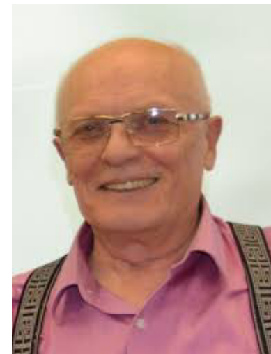
Маевский В.И. (2018). Мезоуровень и иерархическая структура экономики // JIS. № 10.