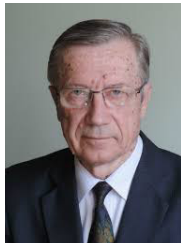
Дементьев В. Е. (2002). Теория национальной экономики и мезоэкономическая теория. // РЭЖ. № 4.

Идея рассмотрения механизма денежного обращения как важнейшего объекта мезоэкономических исследований принадлежит двум известным экономистам: