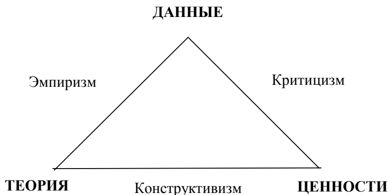
Рис. 2. Интегральная концепция социальных наук Гальтунга

возможным использовать модели, созданные в экономической теории в смежных областях.