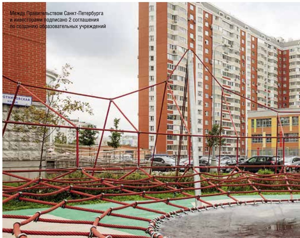
Между Правительством Санкт-Петербурга и инвесторами подписано 2 соглашения по созданию образовательных учреждений

— За рубежом существует большое количество примеров использова-