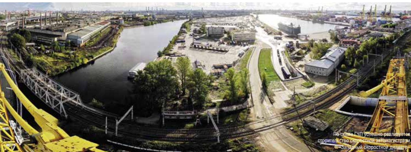
По схеме ГЧП успешно реализуется строительство скоростной автомагистрали «Западный скоростной диаметр»

— В настоящее время проектов ГЧП не так уж и мало, на стадиях управления и реализации находятся около 150 проектов. Не стоит забывать, что не так давно ..»