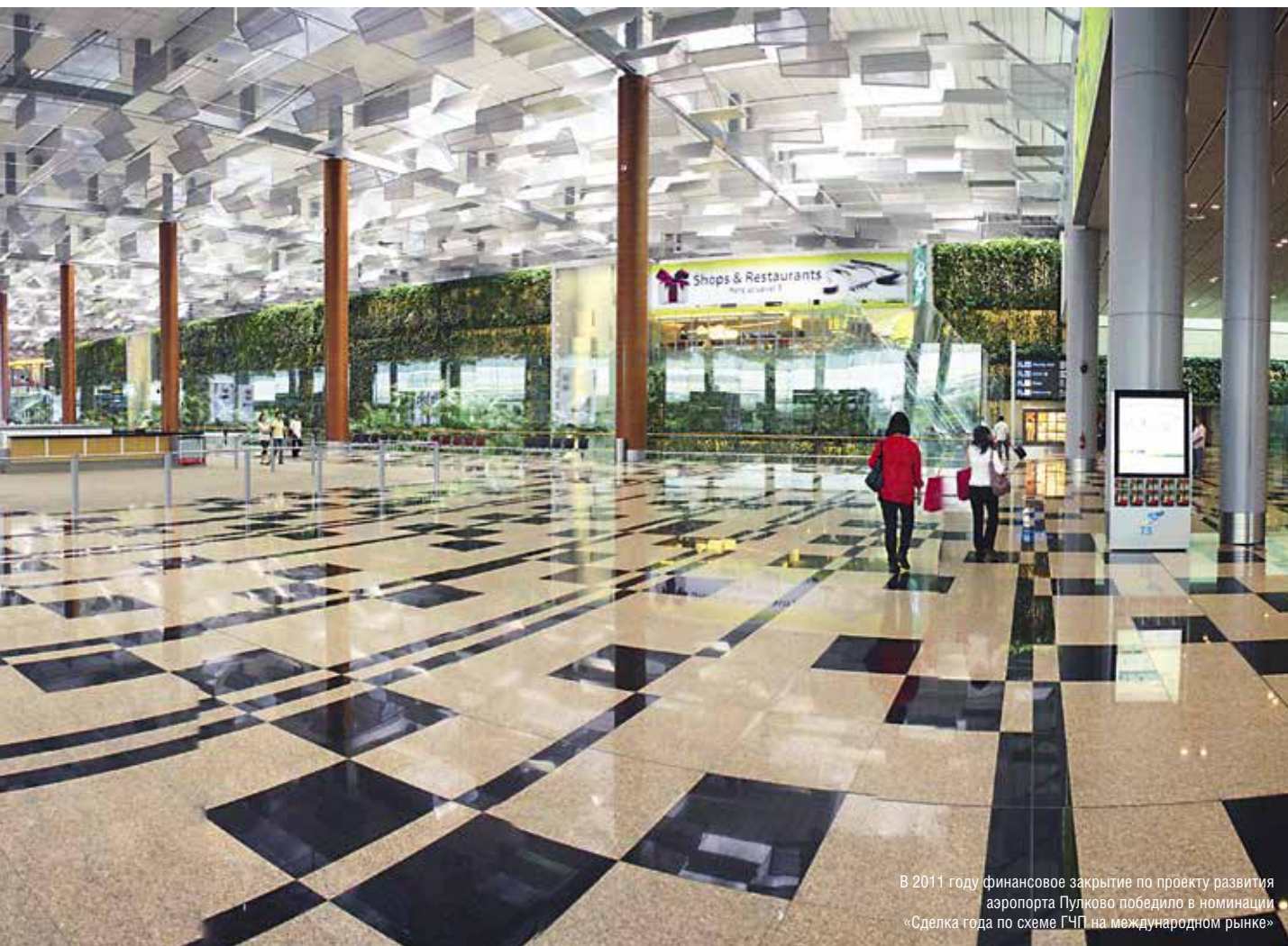
В 2011 году финансовое закрытие по проекту развития аэропорта Пулково победило в номинации «Сделка года по схеме ГЧП на международном рынке»

проектов ГЧП находят- ся на стадиях управле- ния и реализации