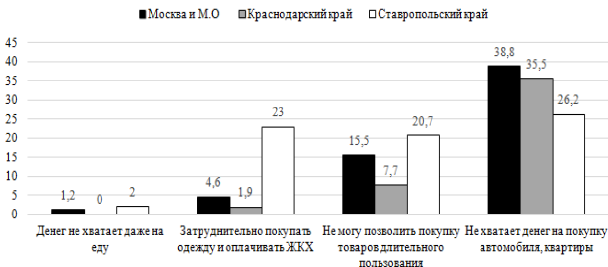
Рисунок 1. Оценка респондентами доходного статуса, в % от числа опрошенных Figure 1. Respondents' Assessment of Income Status, in % of the number of respondents

ния семьи, оплата работы и условия для повышения квалификации, профессионального роста только на среднем. Заметим, что условия для повышения квалификации, профессионального роста являются самым низким по значению индексом для всех регионов.