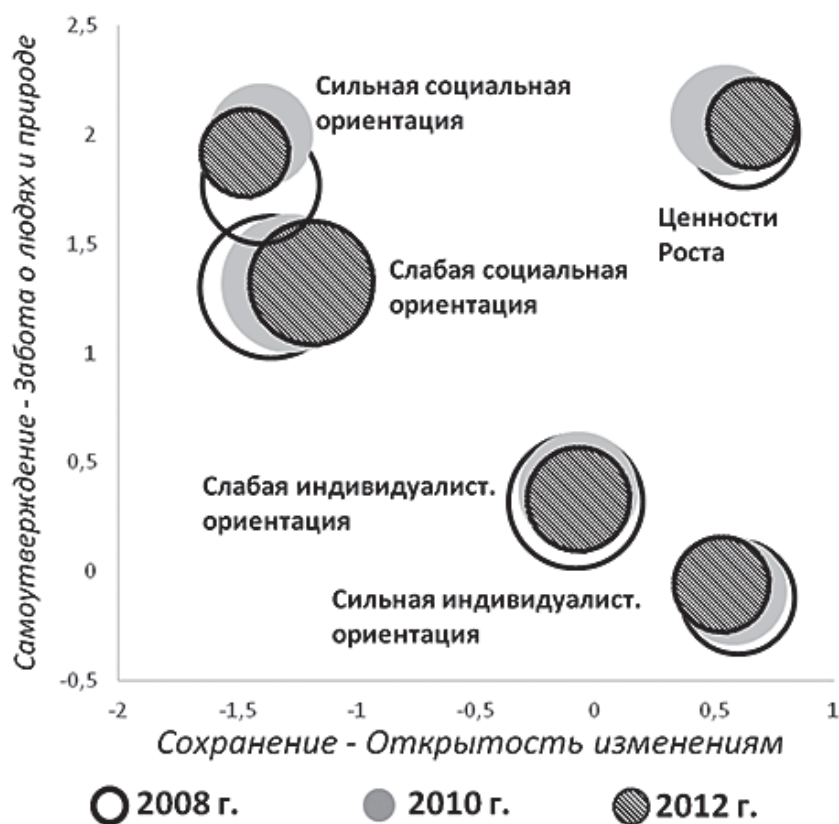
Рис. 1. Ценностные классы европейского населения в пространстве ценностных осей Шварца (объединённая типология европейских стран по трём раундам ESS 2008–2012 гг.; классы расположены в соответствии со средними значениями по каждой из ценностных осей)

Дальнейшие опросы в рамках ESS позволили существенно уточнить ценностную картину, характерную для европейских стран. Во-первых, все исследования, проведённые в 2010-х гг., подтверждают, что россияне вписываются в общую картину европейских ценностей. Во-вторых, каждая страна имеет свою специфику, своё сочетание различных, даже противоположно направленных ценностей. В-третьих, это разнообразие может быть структурировано с выделением ряда групп, характеризующихся преобладанием определённых ценностных компонентов. Анализ материалов трёх исследований ESS — 2008, 2010 и 2012 гг. позволил выделить пять ценностных групп, по-разному располагающихся в пространстве ценностных осей Шварца в соответствии с их средними значениями по каждой из ценностных осей (рис. 1).