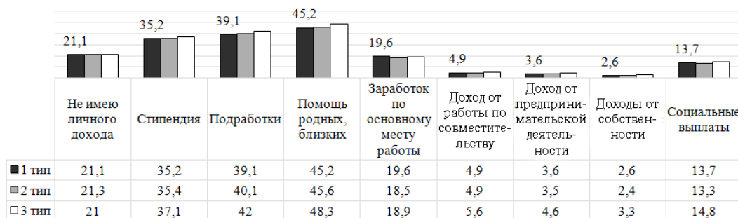
Рисунок 2. Взаимосвязь ценностных приоритетов и источников дохода молодежи Республики Башкортостан, %

занятых по совместительству и предпринимателей, что может интерпретироваться как попытка диверсифицировать доходы и снизить зависимость от внешней поддержки. Индивидуализирующий тип (особенно в группе 30–35 лет) демонстрирует стратегию достижения независимости через предпринимательство и доходы от собственности.