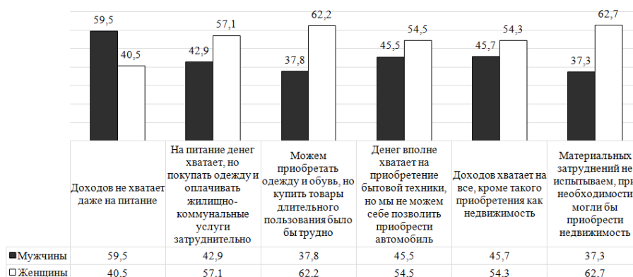
Рисунок 1. Самооценка статуса материального положения семьи респондентов по гендеру (по данным опроса в Республике Башкортостан), % Figure 1. Self-assessment of Family Financial Status among Respondents by Gender (According to a Survey in the Republic of Bashkortostan), %