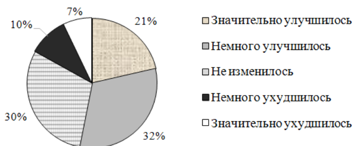
Рисунок 3. Оценка молодежью собственного материального положения в 2024 г. (по данным опроса в Республике Башкортостан), %

Самооценка изменения материального положения за последний год (рисунок 3) показывает поляризованные тенденции: более половины опрошенных констатировали улучшение своего финансового состояния, 30% отметили стабильность, и 16,9% – ухудшение. Эти данные фиксируют общую динамику, но, как следует из регрессионного анализа, не могут быть однозначно интерпретированы вне связи с ценностными ориентациями, которые, оказывают дифференцированное влияние на доходные стратегии.