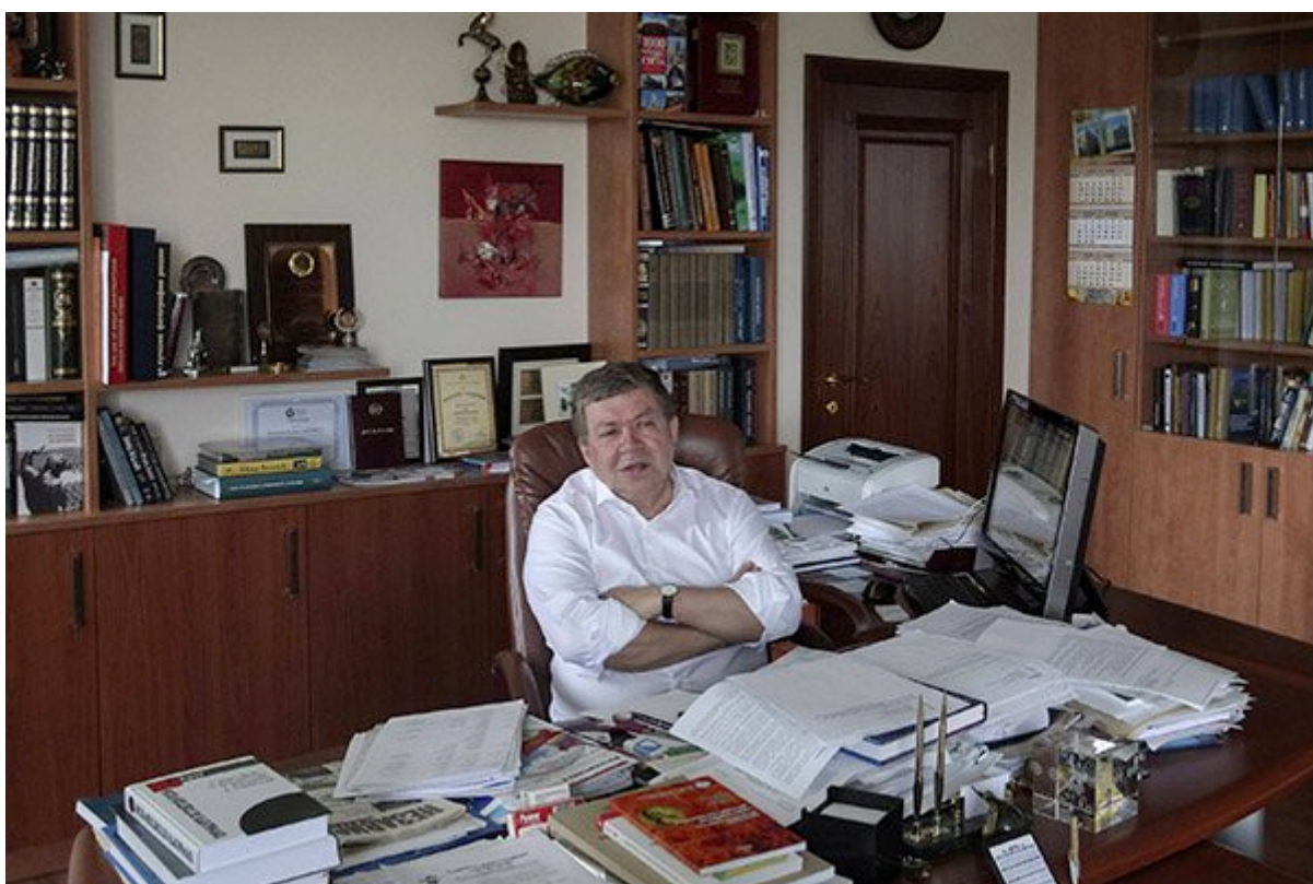
Директор Института экономики РАН Руслан Гринберг

Академик Руслан Гринберг: За счет бедных выходить из кризиса аморально и безграмотно